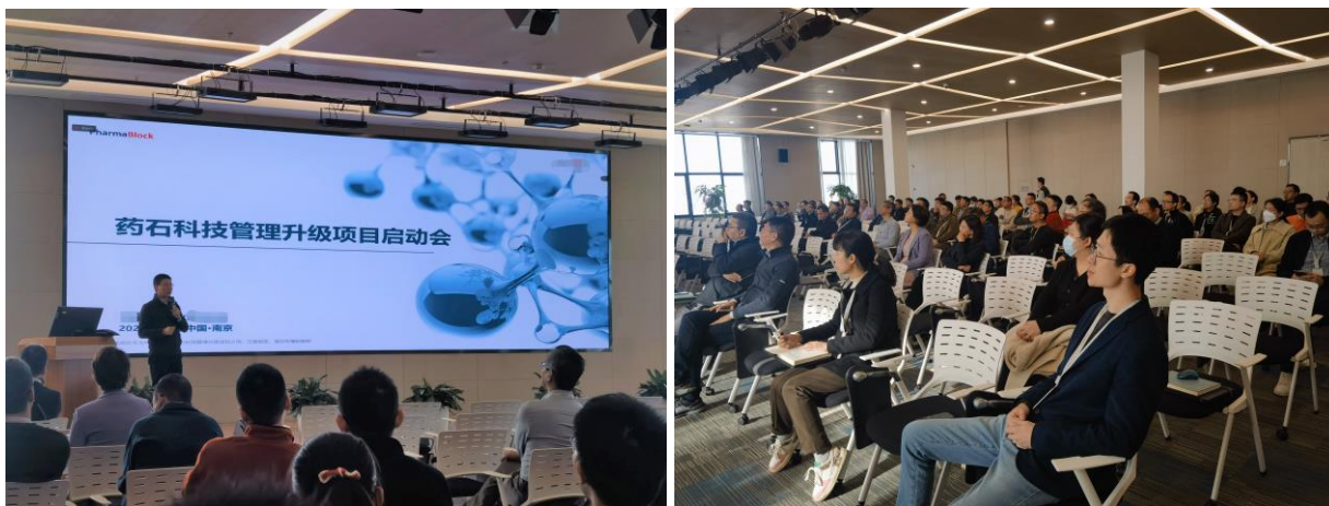
管理升级项目启动会现场

11月22日，药石科技成功举办管理升级项目启动会，并于本月26、27日进行了为期两天的一轮战略研讨会。